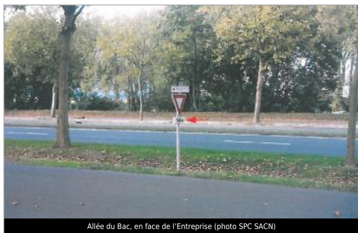
Allée du Bac, en face de l'Entreprise

Altitude calculée de l'eau (en m) : 6.02