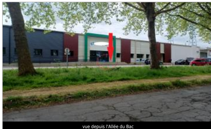
vue depuis l'Allée du Bac