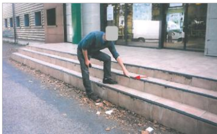
Entreprise - Allée du Bac