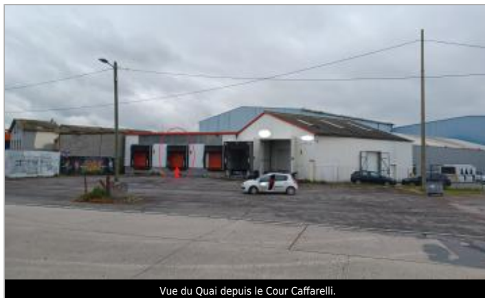
Vue du Quai depuis le Cour Caffarelli.