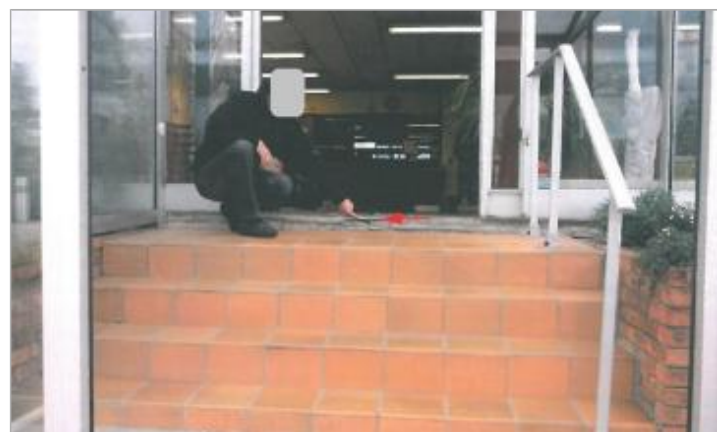
Entreprise - au bout de l'Allée du Bac

GÉNÉRAL Code : ORNEYR1_R_12_02 Date de mise à jour : 02/09/2019 Auteur : SPC.SACN