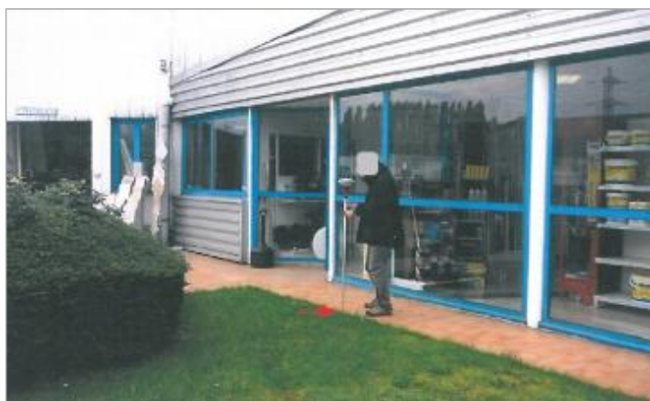
Entreprise - Rue Pasteur