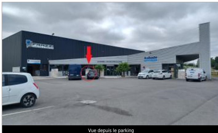
Vue depuis le parking

Coordonnées WGS84 : X: -0.32056980 / Y: 49.18198700