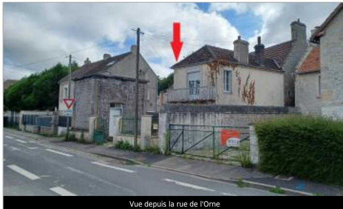
Vue depuis la rue de l'Orne