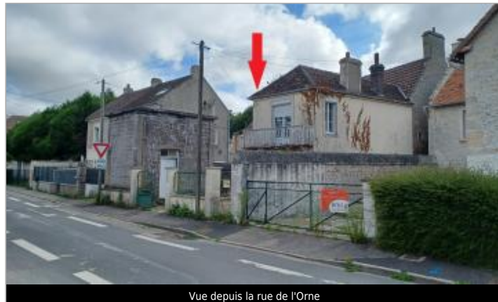
Vue depuis la rue de l'Orne

Coordonnées WGS84 : X: -0.31110020 / Y: 49.19958400