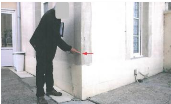
5, Rue de l'Orne