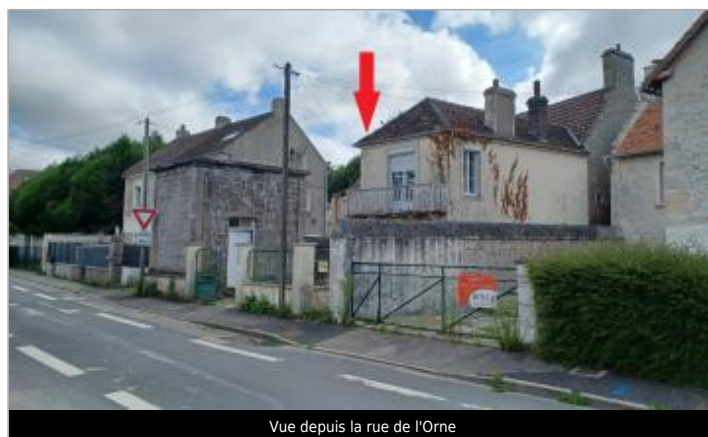
Vue depuis la rue de l'Orne

GÉOLOCALISATION Coordonnées WGS84 : X: -0.31110020 / Y: 49.19958400 Coordonnées RGF93 (Lambert 93) X: 458722.4 / Y: 6905043.97 Coordonnées RGF93 (ETRS89) : X: -0.3111002 / Y: 49.199584 Code Hydro: I2--0200 Rive de référence: Droite