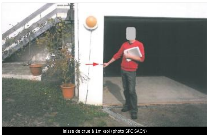
laisse de crue à 1m /sol