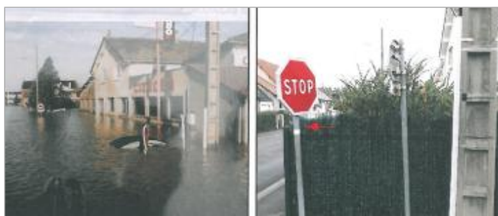
Rue Duquesne, au croisement avec la rue du Bief