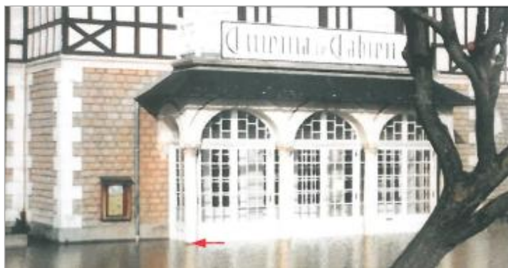
Cinéma - Avenue Michel Cabieu