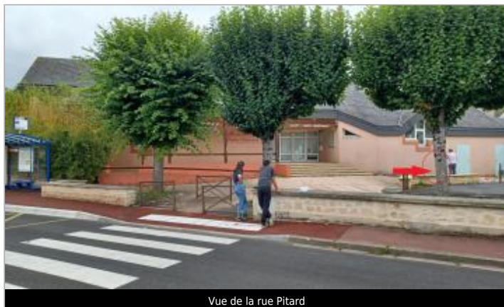
Vue de la rue Pitard

Coordonnées WGS84 : X: -0.38966000 / Y: 49.15690000