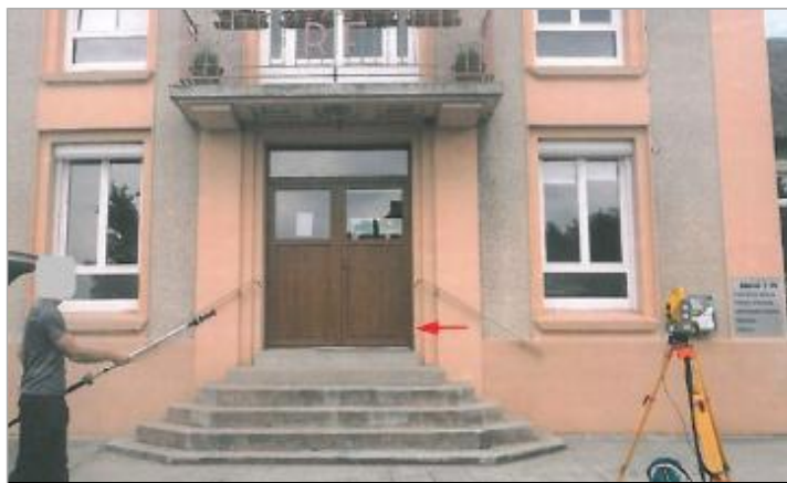
Mairie - 17, Grande Rue

Altitude calculée de l'eau (en m) : 7.17 m