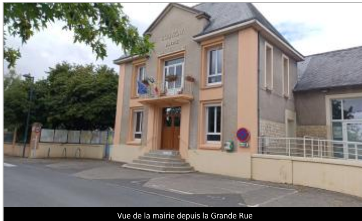
Vue de la mairie depuis la Grande Rue