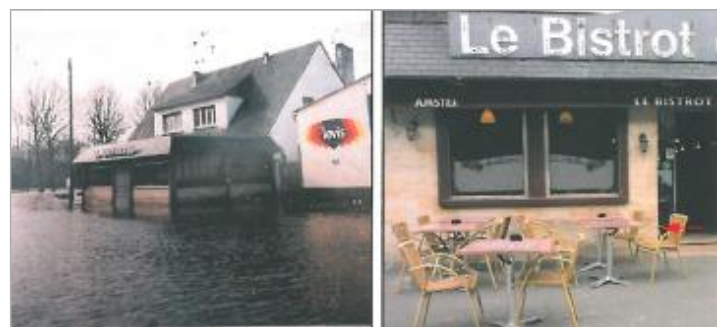
Bistrot - Cours Caffarelli