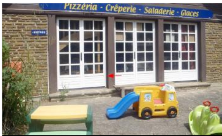
Restaurant - 10, Rue de la Gare