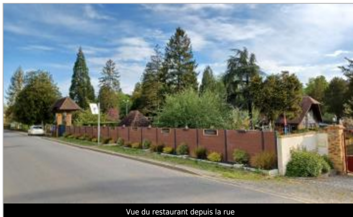
Vue du restaurant depuis la rue