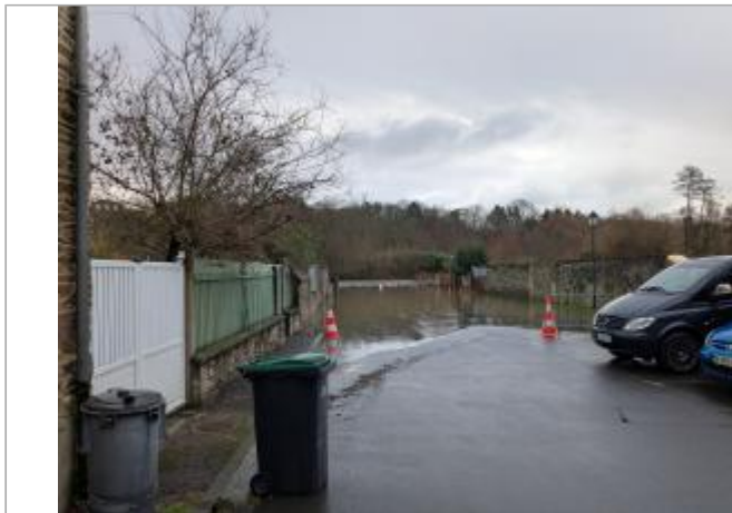
Vue depuis la rue Val d'Orne.