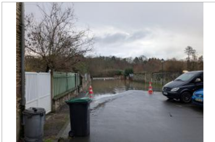
Vue depuis la rue Val d'Orne.