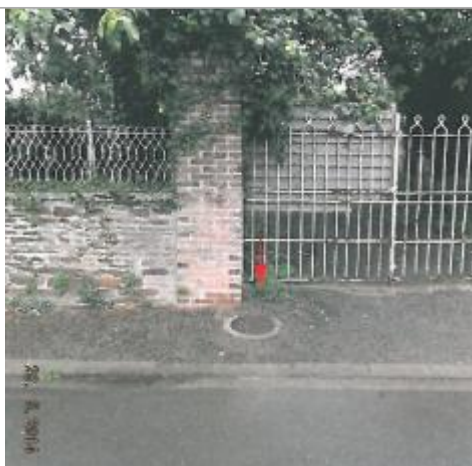
Place du Porche