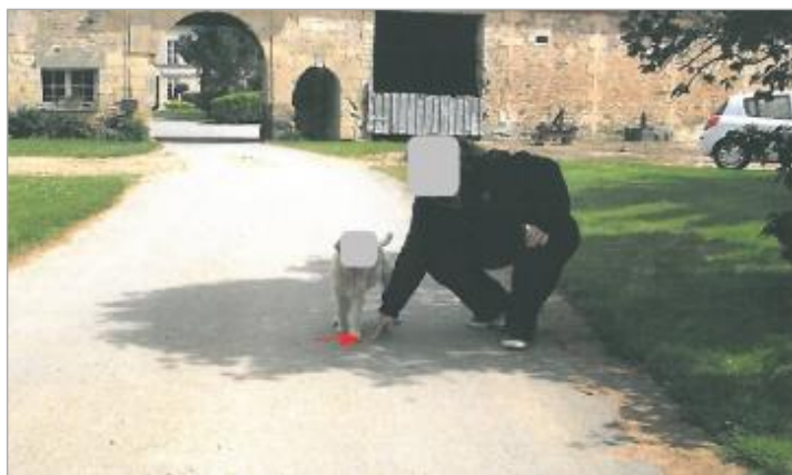
Chemin d'accès du Lieu-dit Athis