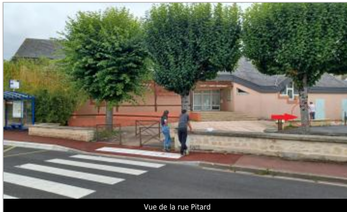
Vue de la rue Pitard