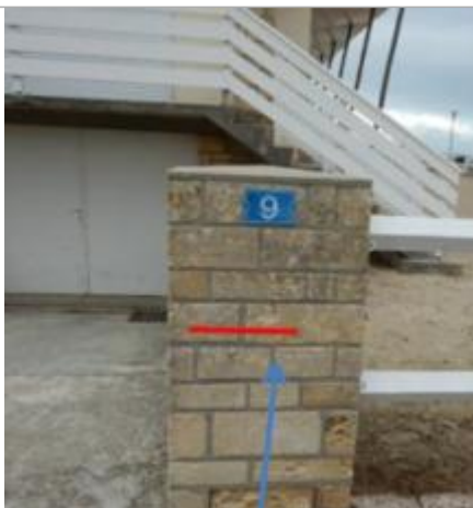
9, Avenue Saint-Gerbould