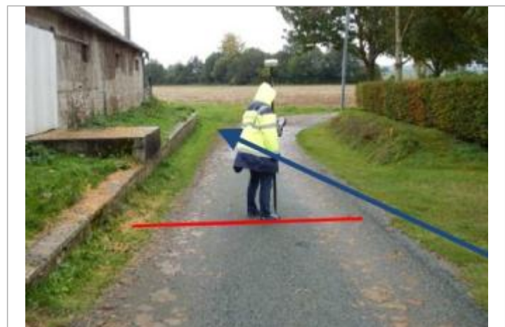
Guichaumont (partie Sud)