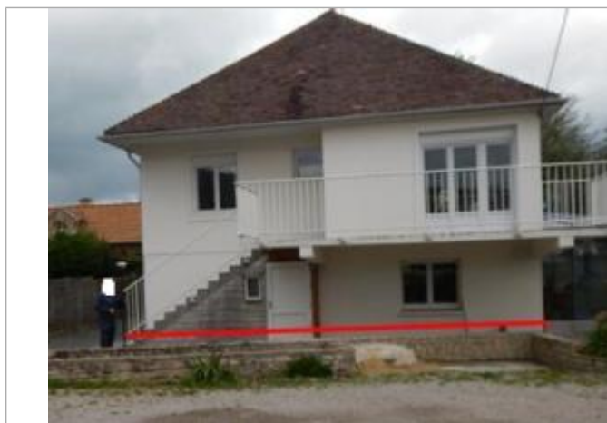
8, Rue du Débarquement