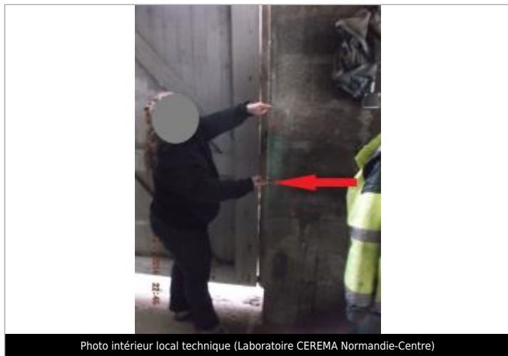
Photo intérieur local technique (Laboratoire CEREMA Normandie-Centre)

Altitude calculée de l'eau (en m) : 48.91