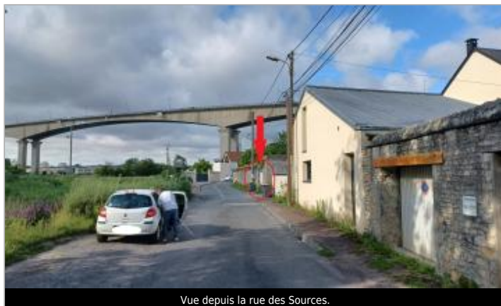
Vue depuis la rue des Sources.

Coordonnées WGS84 : X: -0.32886000 / Y: 49.18801000