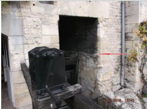
Moulin au bout de l'impasse du Dan - Passerelle aval