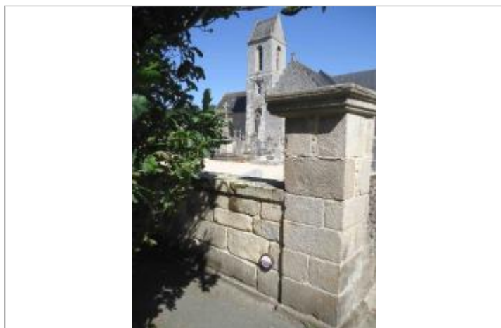
Repère pilier du cimetière 2014

Altitude calculée de l'eau (en m) : 24.92 m