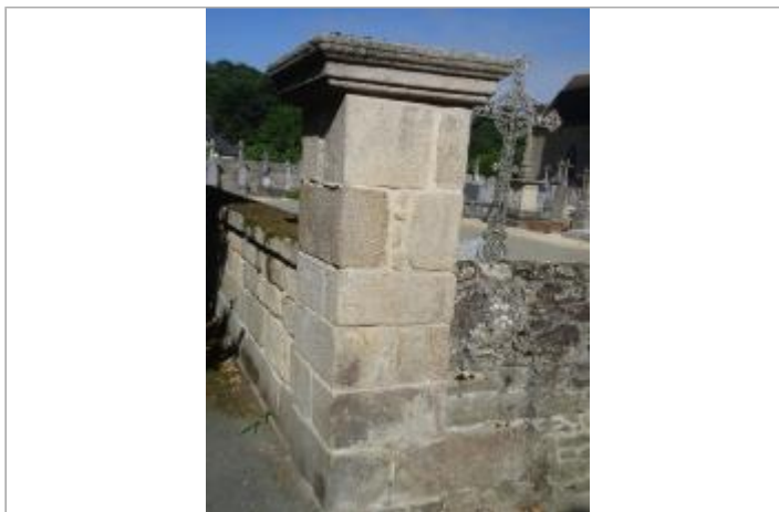
Pilier du cimetière - Source : SMAP, 2018