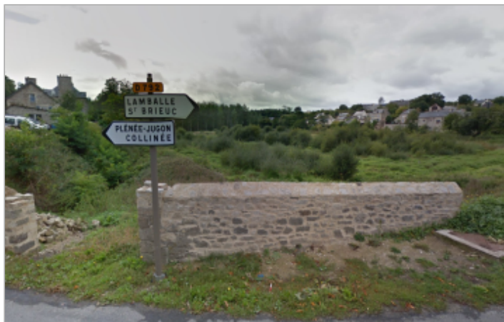
Entrée ancien étang - Source : Google Maps, septembre 2013