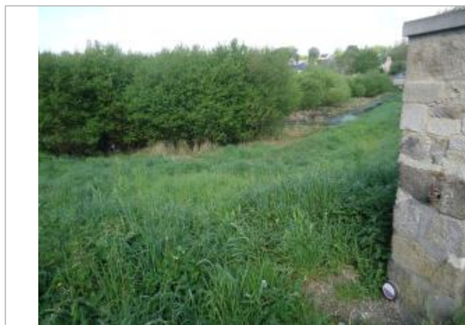
Pilier nord de l'étang - Source : SMAP, mai 2018

Altitude calculée de l'eau (en m) : 30.56 m