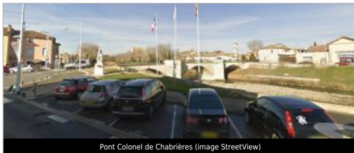
Pont Colonel de Chabrières