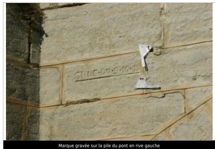
Marque gravée sur la pile du pont en rive gauche