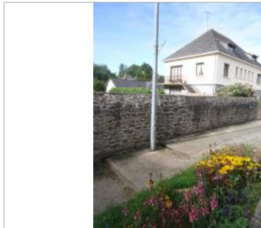
Muret rue de Clisson