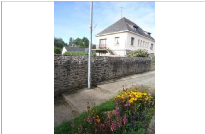
Muret rue de Clisson