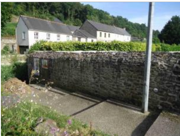
Repère de crue 2014 rue de Clisson - Source : SMAP, juin 2018

Altitude calculée de l'eau (en m) : 26.12 m