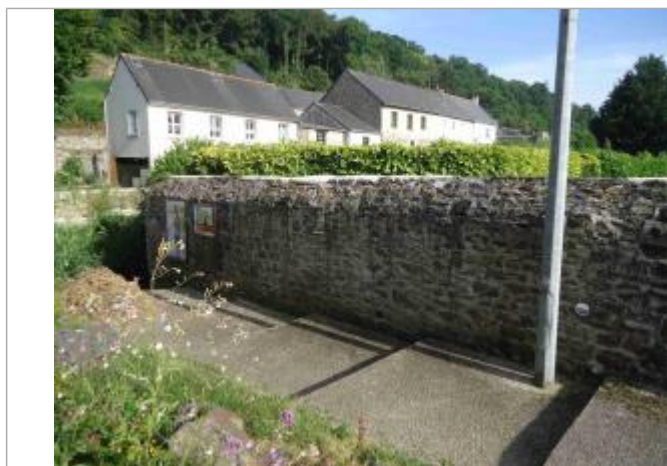
Repère de crue 2014 rue de Clisson - Source : SMAP, juin 2018