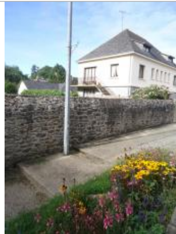
Muret rue de Clisson