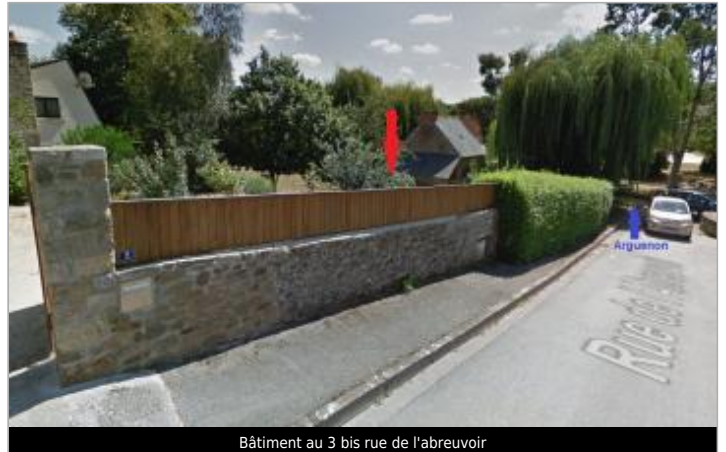
Bâtiment au 3 bis rue de l'Abreuvoir