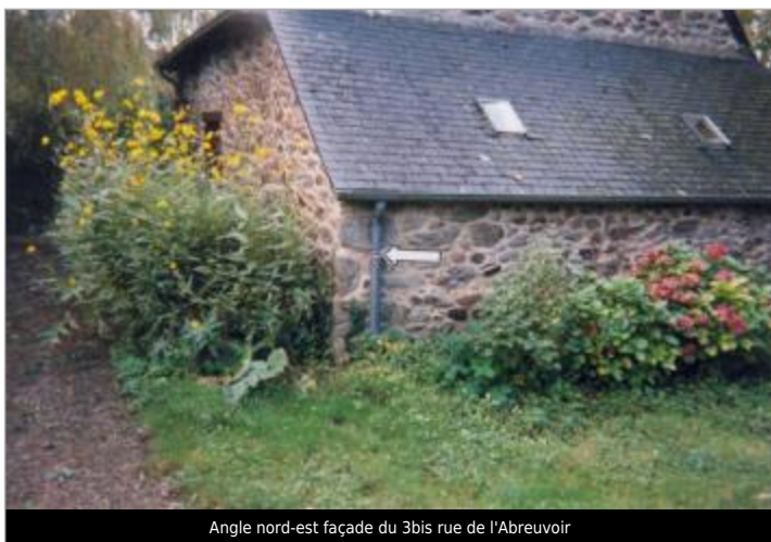
Angle nord-est façade du 3bis rue de l'Abreuvoir