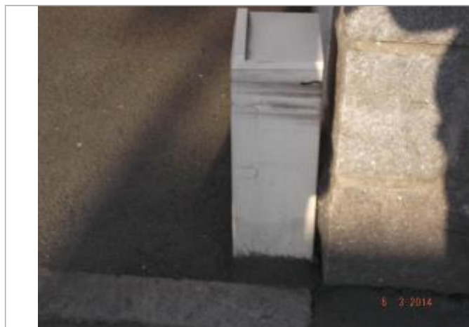
Marque sur le coffret EDF