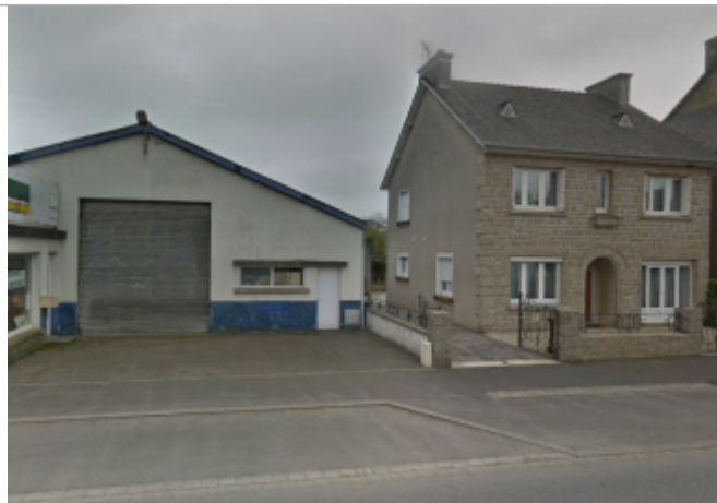
Coffret EDF