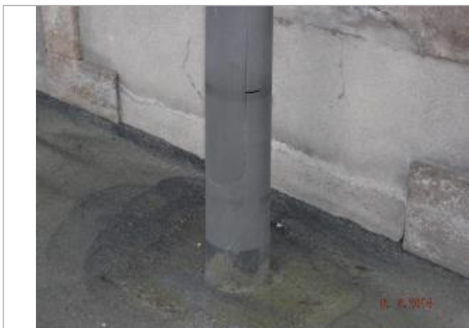
Marque sur le candélabre