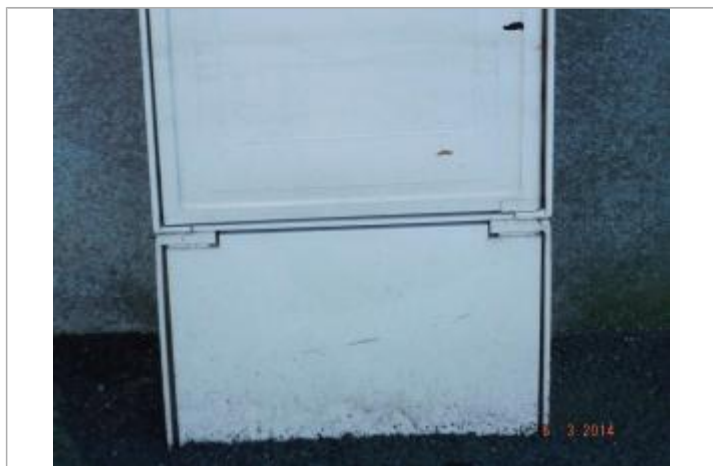
Marque sur le coffret EDF

Altitude calculée de l'eau (en m) : 8.07