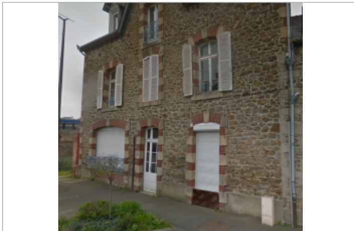
N°10 rue de Dinard (coffret EDF) - Source : Google Maps, avril 2018