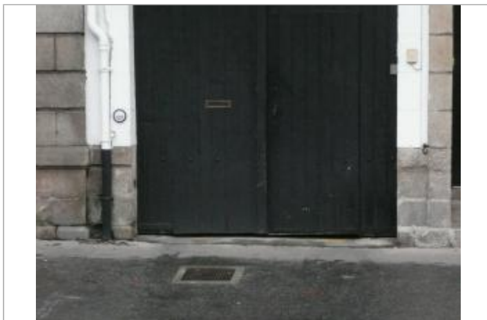
7, boulevard Amiral de Kerguélen - Entrée du commerce