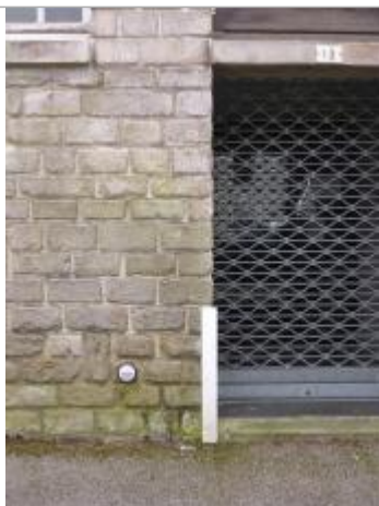
13, rue de la Palestine - 13 décembre 2000