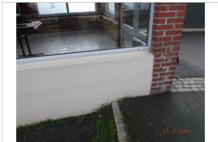
LdC muret du bar

Altitude calculée de l'eau (en m) : 7.73