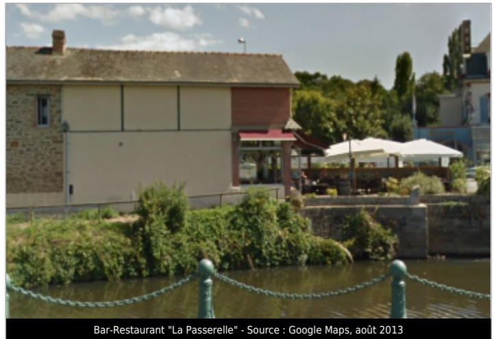
Bar-Restaurant "La Passerelle"

Coordonnées WGS84 : X: -2.23010490 / Y: 48.52173200