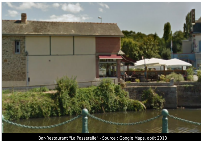
Bar-Restaurant "La Passerelle"