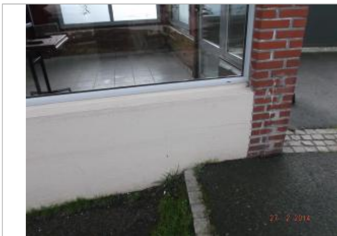
LdC muret du bar

Altitude calculée de l'eau (en m) : 7.73