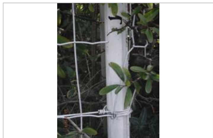
Laisse de crues grillage

GÉNÉRAL Code : SMAP_2018_R19 Date de mise à jour : 24/03/2020 Auteur : SMAP