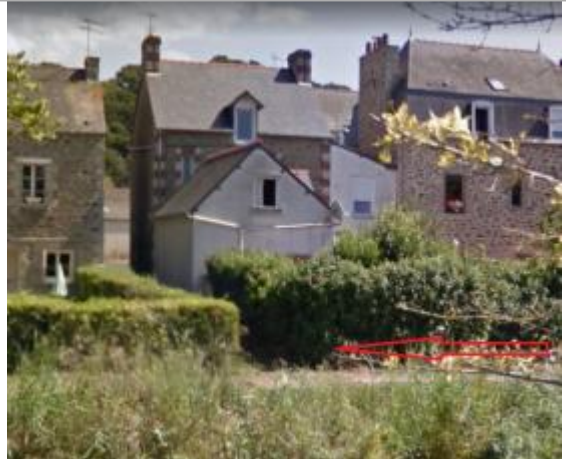
Angle du passage vers la route départementale, support de clôture de couleur blanche côté rivière (quai Jacques Cartier)

Coordonnées WGS84 : X: -2.22996710 / Y: 48.52347800