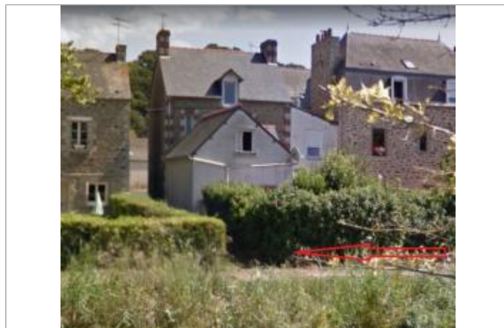
Angle du passage vers la route départementale, support de clôture de couleur blanche côté rivière (quai Jacques Cartier)

GÉOLOCALISATION Coordonnées WGS84 : X: -2.22996710 / Y: 48.52347800 Coordonnées RGF93 (Lambert 93) X: 314087.01 / Y: 6837589 Coordonnées RGF93 (ETRS89) : X: -2.2299671 / Y: 48.523478 Code Hydro : J11-0300 Rive de référence : Droite