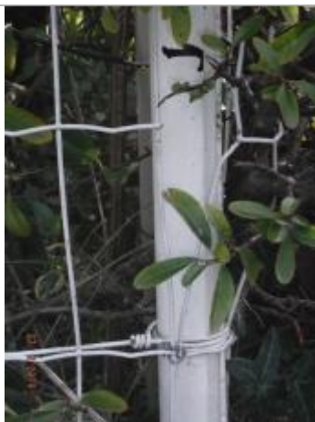
Laisse de crues grillage

Altitude calculée de l'eau (en m) : 7.81 m