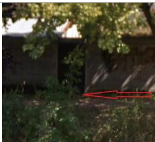
Porte au fond du jardin, côté rivière (quai Jacques Cartier)

Altitude calculée de l'eau (en m) : 7.88 m