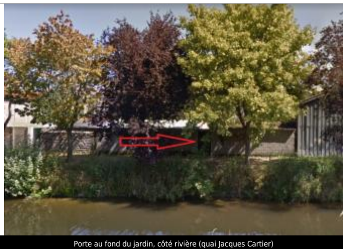
Porte au fond du jardin, côté rivière (quai Jacques Cartier)