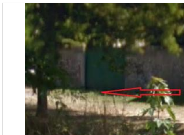
Portail vert situé à l'arrière du bâtiment du côté de l'Arguenon (quai Jacques Cartier)

Altitude calculée de l'eau (en m) : 7.78 m