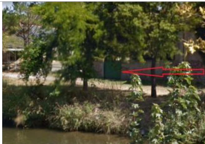
Portail vert situé à l'arrière du bâtiment du côté de l'Arguenon (quai Jacques Cartier)