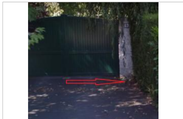
sol au pied du poteau droit du portail d'entrée