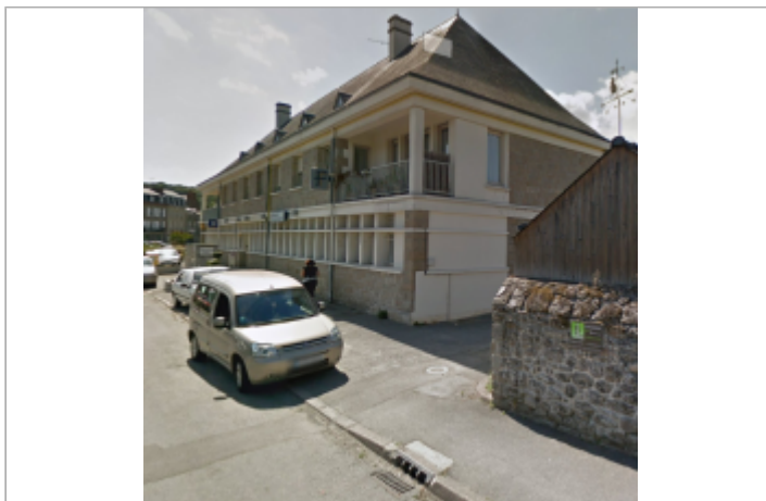
Angle 3 quai du Duc d'Aiguillon