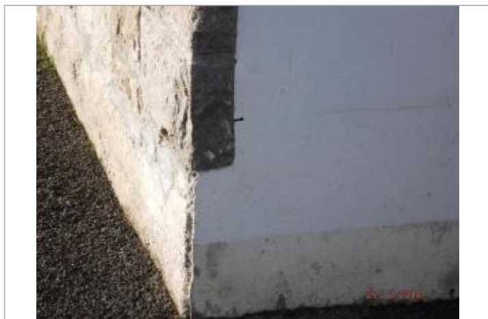
LdC mur