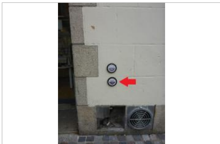
Quai du Port au Vin - Février 1974