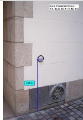
Quai du Port au Vin - entrée du Monoprix