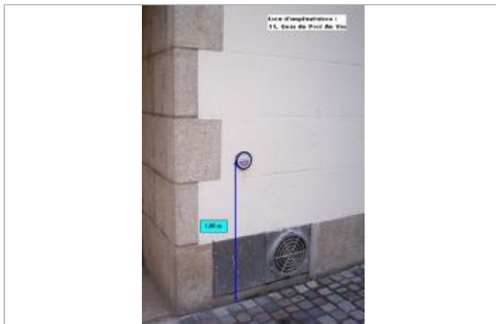
Quai du Port au Vin - entrée du Monoprix