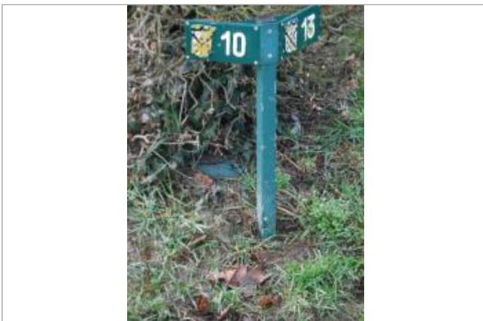
Emplacement n°10

GÉOLOCALISATION Coordonnées WGS84 : X: -2.23321510 / Y: 48.52026000 Coordonnées RGF93 (Lambert 93) X: 313824 / Y: 6837247.94 Coordonnées RGF93 (ETRS89) : X: -2.2332151 / Y: 48.52026 Code Hydro: J11-0300 Rive de référence: Droite