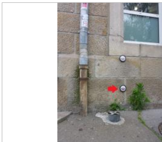
37, boulevard Amiral de Kerguelen - Février 1974

Altitude calculée de l'eau (en m) : 4.92 m