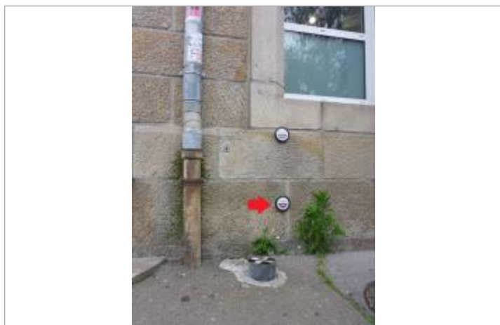
37, boulevard Amiral de Kerguelen - Février 1974