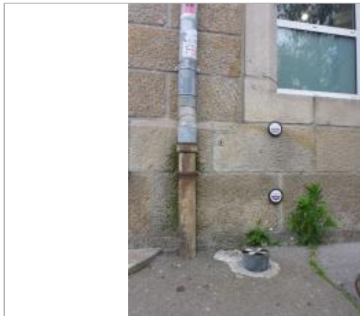
37, boulevard Amiral de Kerguelen - Entrée principale de la Poste

Coordonnées WGS84 : X: -4.09981330 / Y: 47.99528900