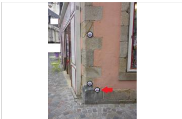
30, rue René Madec - Janvier 1995

Texte : Ville de Quimper - Inondation - Janvier 1995 - Le Steir Maximum de l'inondation : Oui Visibilité : Oui État du repère : Bon Pérennité : Longue Repère calculé : Non PHEC : Non