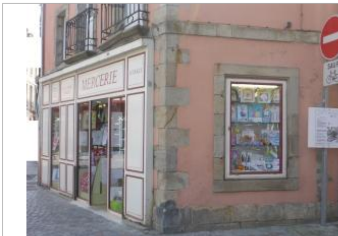
30, rue René Madec - Angle de la mercerie