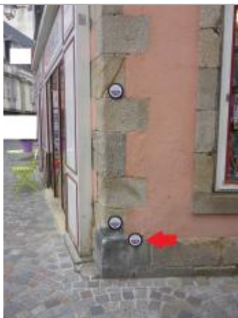
30, rue René Madec - Janvier 1995

Altitude calculée de l'eau (en m) : 3.8 m