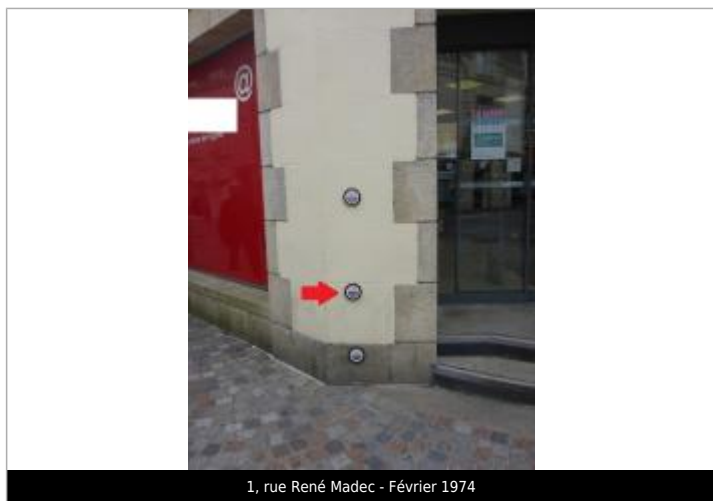
1, rue René Madec - Février 1974

Code : STEIR_27_1974 Date de mise à jour : 29/04/2023 Auteur : SIVALODET