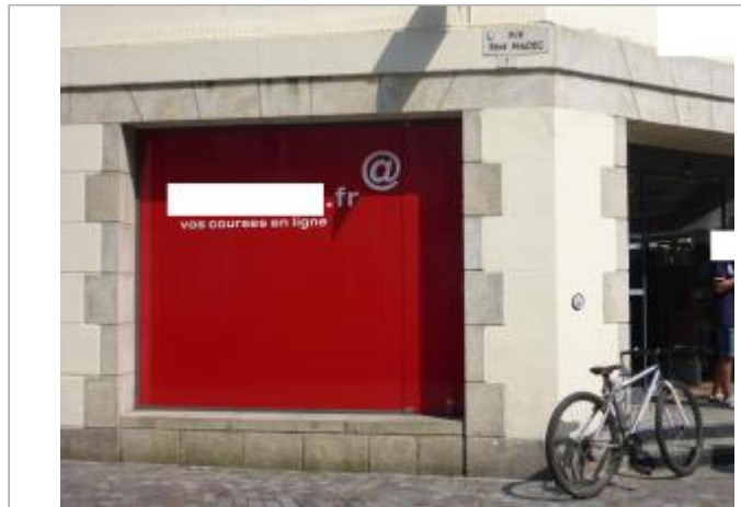
1, rue René Madec - Entrée principale du Monoprix

Coordonnées WGS84 : X: -4.10604680 / Y: 47.99489400