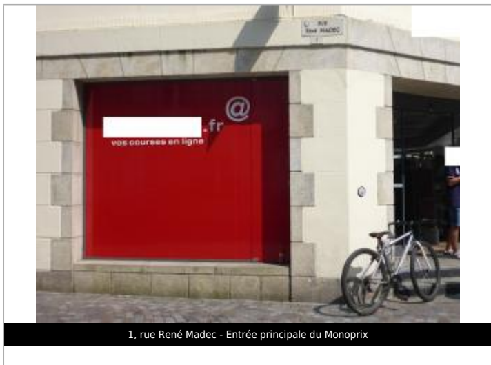
1, rue René Madec - Entrée principale du Monoprix