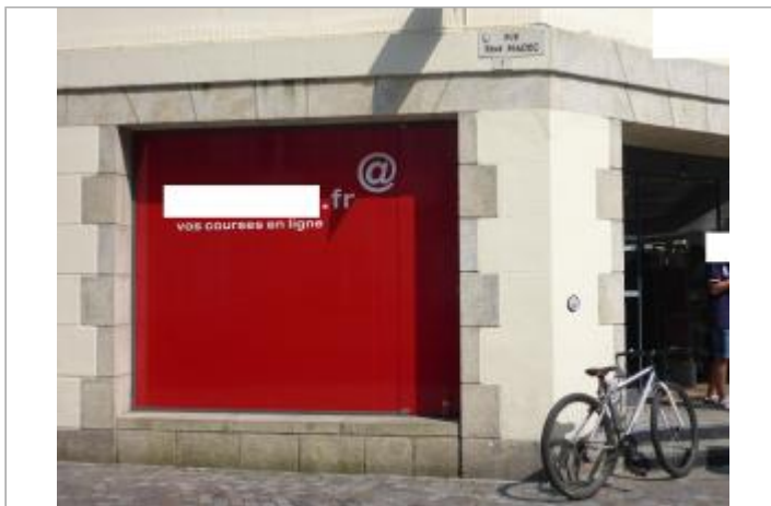
1, rue René Madec - Entrée principale du Monoprix