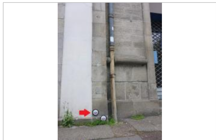
17, boulevard Amiral de Kerguélen - Février 1974

GÉNÉRAL Code : ODET_35_1974 Date de mise à jour : 04/03/2022 Auteur : SIVALODET