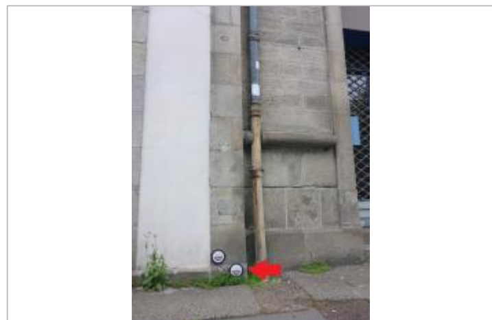
17, boulevard Amiral de Kerguélen - Janvier 1995

GÉNÉRAL Code : ODET_35_1995 Date de mise à jour : 04/03/2022 Auteur : SIVALODET