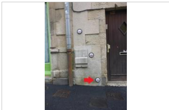
12, rue des Réguaires - Janvier 1995