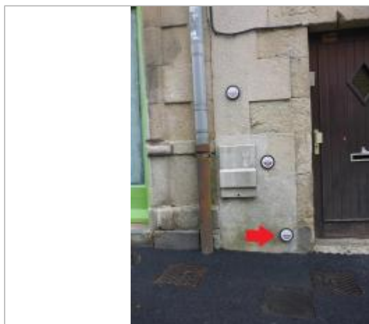
12, rue des Réguaires - Janvier 1995

Texte : Ville de Quimper - Inondation - Janvier 1995 - Odet