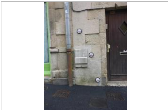
12, rue des Réguaires