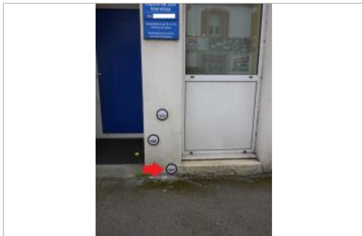
60-62, avenue de la Libération - Janvier 1995

Altitude calculée de l'eau (en m) : 6.1 m