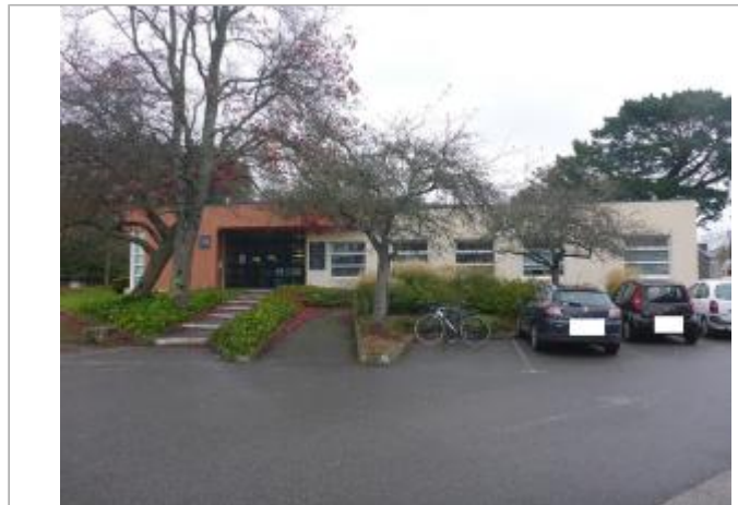
55, impasse de l'Odet - Entrée de la Maison des Associations

Coordonnées WGS84 : X: -4.08906830 / Y: 47.99536900